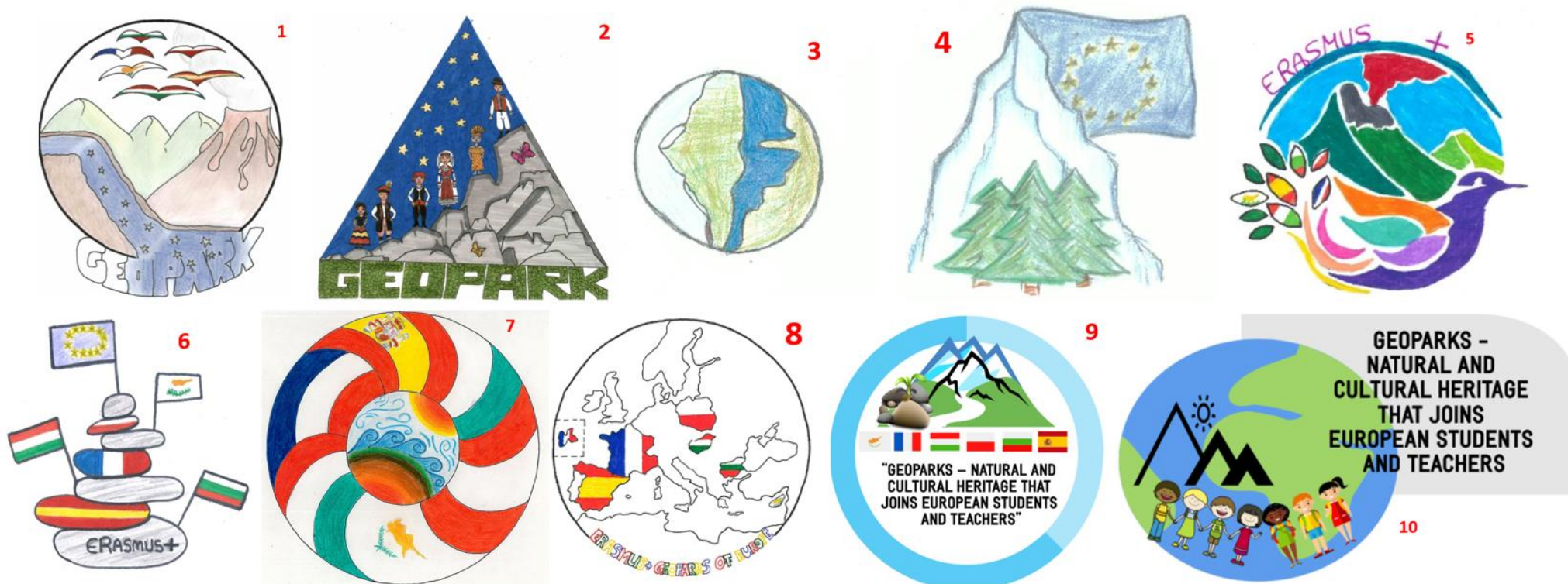
Σχήμα 4: Τα δέκα λογότυπα που στάλθηκαν στην ομάδα μας για ψηφοφορία από τα 5 άλλα σχολεία των χωρών που συμμετέχουν στο πρόγραμμα.

σχήμα 4 αριθμημένα. Επίσης τα δικά μας λογότυπα είχαν τα νούμερα 11 (αυτό της Νεόβης) και 12 αυτό του Σεμπάστιαν) αλλά δεν τέθηκαν σε ψηφοφορία από την δική μας ομάδα. Η ψηφοφορία των μαθητών της ομάδας του προγράμματος του Λυκείου Αγίου Ιωάννη έγινε από τις 15 μέχρι τις 21 Δεκεμβρίου του 2018. Τα λογότυπα του σχήματος 4 συγκέντρωσαν όλα από μία ψήφο εκτός από τα λογότυπα 2, 5, 8, 9 και 10 που πήραν από δύο ψήφους. Τα αποτελέσματα της ψηφοφορίας της Κυπριακής ομάδας του προγράμματος στάλθηκαν στη συντονίστρια του προγράμματος στις 21 Δεκεμβρίου του 2018.