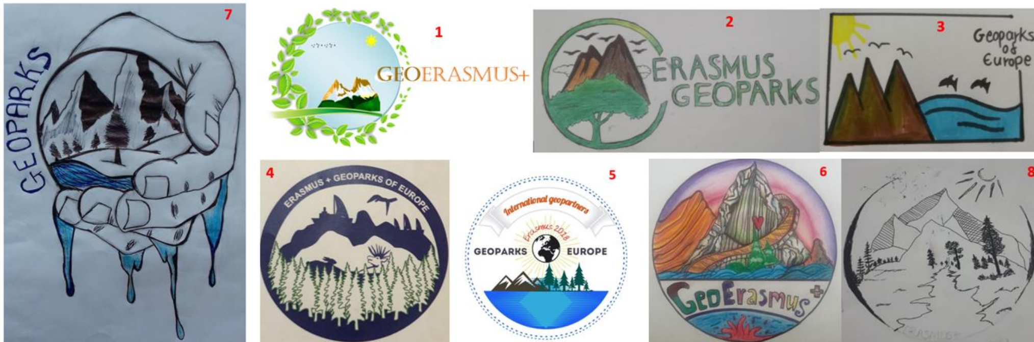
Σχήμα 1: Αριθμημένα λογότυπα που μπήκαν στη διαδικασία της ψηφοφορίας. Τα αποτελέσματα της ψηφοφορίας παρουσιάζονται στον Πίνακα 1.

Στον ενδοσχολικό διαγωνισμό λογοτύπου του Λυκείου μας, συμμετείχαν πέραν των 10 μαθητών και παραδόθηκαν 8 λογότυπα τα οποία τίθενται προς ψήφιση (2 ψήφους ο καθένας) από τους μαθητές και εκπαιδευτικούς που συμμετέχουν στο πρόγραμμα Erasmus Plus με τίτλο: GEOPARKS - NATURAL AND CULTURAL HERITAGE THAT JOINS EUROPEAN STUDENTS AND TEACHERS, 2018-1-PL01-KA229-050575_5 . Στη διαδικασία ψηφοφορίας δε θα συμμετέχει ένας μαθητής που έλαβε μέρος και στον διαγωνισμό του λογοτύπου άρα θα έχουμε στο τέλος 40 ψήφους (14 μαθητές και 6 καθηγητές επί δύο). Από την ψηφοφορία θα επιλεχθούν 2 λογότυπα που θα σταλούν στον ευρωπαϊκό διαγωνισμό του προγράμματος. Πριν να αποσταλούν τα λογότυπα στον διαγωνισμό θα γίνει προσπάθεια από την εκπαιδευτικό κα Μαρία Χατζημιχαήλ Πουλιάου, της ομάδας καθηγητών του προγράμματος, για βελτίωση των λογοτύπων. Οι μαθητές με τα δύο διακριθέντα λογότυπα θα μπορούν να συμμετέχουν στην τριήμερη εκπαιδευτική εκδρομή που θα πραγματοποιηθεί στον Πεδουλά από το Σάββατο 19 μέχρι και τη Δευτέρα 21 Ιανουαρίου 2019. Αν τώρα διακριθεί κάποιο λογότυπο και στον Πανευρωπαϊκό διαγωνισμό, τότε ο μαθητής του οποίου ανήκει το λογότυπο θα μπορεί να πάει ένα ταξίδι με το πρόγραμμα είτε στην Ουγγαρία είτε στην Πολωνία ανάλογα με την τάξη που είναι και την έγκριση που θα μας δώσουν οι εταίροι μας.